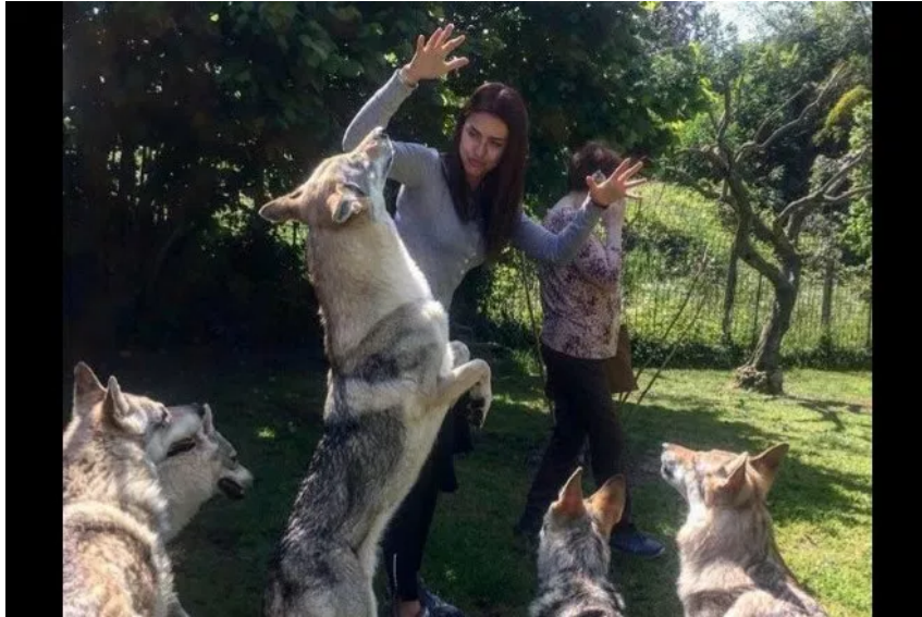
Una foto durante le prove di Who's the Beast.

Attesa per la presentazione del cortometraggio Who's the Beast , prevista per il prossimo 31 ottobre al Cinema Caravaggio ai Parioli. L'opera prima della regista Diletta Di Nicolantonio promette di sbalordire gli spettatori.